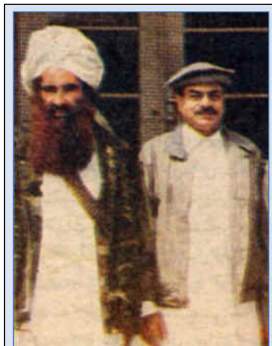
Jalaluddin Haqqani with Gen. (R) Hamid Gul, former director general of Pakistani ISI.

یک میدان جدید جنگ و رقابت آباد حکومت کرسی را رسماً متهم دسترسی به سرحدات غربی همچنان سازمان استخبارات (Analysis Wing) را به حمایت خاک افغانستان، متهم میسازد. میان مسوولین بلندرتبه سازمان کنار رفته ریاست عمومی امنیت پاکستان صورت گرفته است. روزنامه (مشرق) چاپ پشاور، متوصل به چنین ادعا ها شده اند ها در صوبه بلوچستان و صوبه