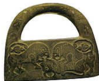
وزنه سنگی، جیرفت (۳ هزار سال قبل از میلاد)، موزیم آذربایجان.

میشود که موجودیت آن به ۳۰۰۰ ق.م. میرسد. طبق آثار خطی موجود، معلوم میشود که از حدود ۳۲۰۰ ق.م. شروع و قدیم ترین تمدن تاریخی جهان را ساخته و تا حدود ۵۳۹ ق.م. دوام داشته است. اوائل عهد برونز، شاهد ارتقاء دهات به شهرهای تنظیم شده؛ و اختراع نوشتن (دوره ارک [۶]) در شرق نزدیک بود.