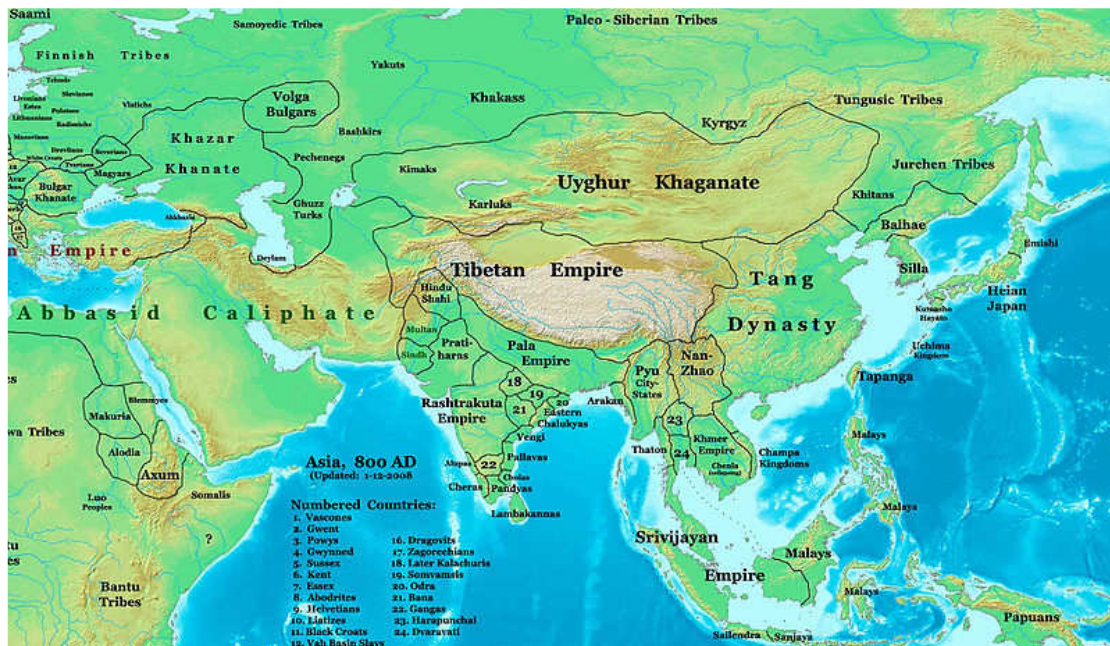
نقشه آسیای ۸۰۰ م. ساحه شاهی را نشان میدهد.

در بارۀ ناکامی لالیا نظر به آن شرایط میتوان نوشت که وی به دلیل چپاول تاج شاهی از کدام پشتیبانی ویژه بی بهرمند نبود. اما وارث سمکراوارمن در کشمیر، در ۹۰۲، پیمان مصالحه پی رابا هندو شاهی بست: مطابق این پیمان، با نشاندن پسر لالیا، تورامانا [۹] بحیث شاه جدید (کملوکا [۱۰] ۹۰۲ - ۹۴۰)، افغانستان را دوباره بخود ملحق ساخت، ولی افغانستان عملاً آزاد بود. بعد از مدت کوتاهی (حدود ۹۰۶) اغتشاش در کشمیر رخ داد و هندوشاهی توانست پنجاب را بگیرد. بعد از آن یک دوران طولانی اتحاد از طریق ازدواج با خاندان شاهی کشمیر بوجود آمد: نواسۀ بهما دیوا [۱۱] (حکومت. حدود ۹۴۰ - ۹۶۵)، دیدا مربوط به لوهارا [۱۲] ملکه کشمیر شد (حدود ۹۵۸ - ۱۰۰۳). بعد از ملکه دیدا، برادر زاده اش سنگراما راجا (حکومت. ۱۰۰۳ - ۱۰۲۸) در کشمیر بقدرت رسید، او اتحاد خود را با هندو شاهی برقرار نگاه داشت.