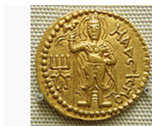
Mahasena on a coin of Huvishka .

خدایان دینی کوشان فوق العاده متنوع بود، طوریکه از سکه ها ومهر های شان بر ملا است که در آن بیشتر از ۳۰ خدای مختلف ، متعلق به هلنیستی، به ایرانی و به اندازه کم از دنیای هند ظاهر شد. خداوندان یونانی با نامهای یونانی در سکه های پیشین نشان داده شد، در زمان حکومت کنشکا زبان مضروبات تبدیل به باختری شد. بعد از هویشکا فقط دو خدا در سکه ظاهر شد: ار دوکشو [۷۰] و اوشو [۷۱].