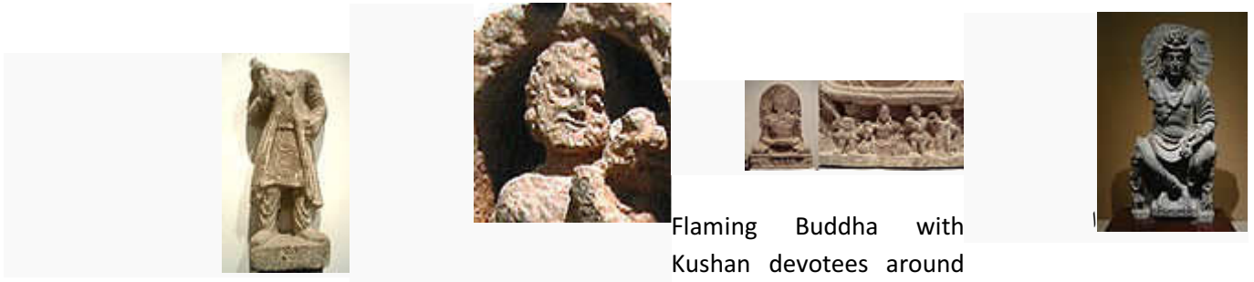
Kushan costume. Flaming Buddha with Kushan devotees around Maitreya. Maitreya, with Kushan devotee couple. 2nd century Gandhara.

هنر وکلچر گندهارا، در تقاطع هیژمونی کوشان، بهترین آثار شناخته شده از نفوذ کوشان بر غربی ها میباشد. تعداد زیادی از نمایش های مستقیم کوشان از گندهارا شناخته شده است، که با تونیک [۸۱] کمر بند و شلوار برای اینکه رول مومن برای بودا، بودهیزتوا و بودا میترا را بازی کرده باشد.