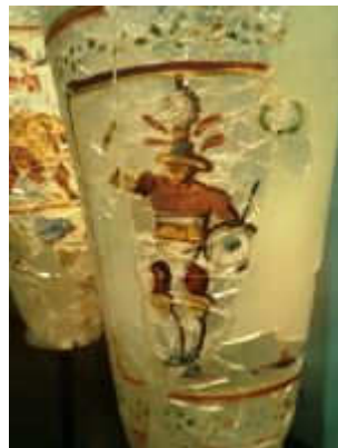
یک گلادیاتور روم - یونان در سطل شیشه، بگرام قرن دوم

پایتخت تابستانی کنشکا در بگرام یک مقدار قابل ملاحظه اشیا ی وارد شده از امپراطوری روم، مخصوصا ظروف متنوع شیشه را، بخود نگاه میدارد".