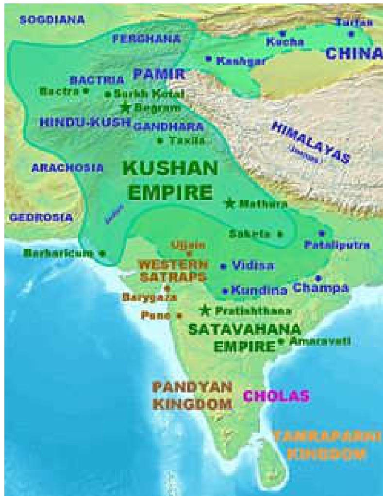
ساحه تسلط کوشان در زمان کنشکا نظر به کتیبه رباطک

این امپراطوری توسط کوشان شاخه از کنفدراسیون یوچی [۲] بوجود آمد. اعتقاد بر اینست که از مردمان هندو اروپائی شرقی تریم بسین [۳] چین بوده و ممکن مربوط تخاری ها باشند. روابط دیپلماتیک با روم، فارس و چین داشته و برای قرن ها در مرکز تبادل بین شرق و غرب قرار داشتند.