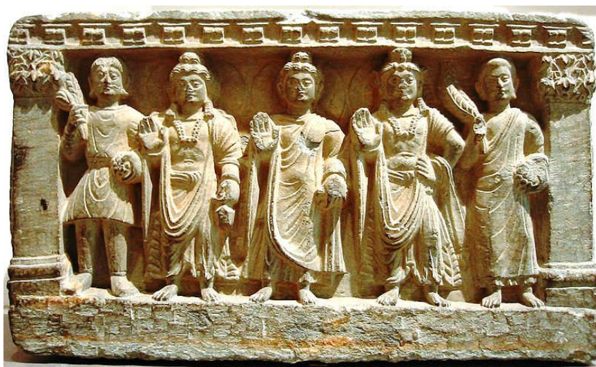
یک گروپ سه گانه بودا ی مهائانا [۷۷]. از چپ بر راست

در زمان کوشان ها تبادل فرهنگی شکوفان شد، تکامل بودیزم یونانی را تشویق کرد، و آن یک ادغام هلنیستی و عناصر کلتور بودائی بود که بحیث مهائیا بودیزم در آسیای مرکزی و شمالی توسعه یافته بود. کنیشکا، دعوت کننده شورای بزرگ بودائی در کشمیر، در عنعنات بودائی مشهور است را. کنشکا همچنان زبان محلی گندهاری یا پرکتریت [۷۲] را در نظر داشت، متن های بودائی را بزبان سنکریت ترجمه کرد. همراه با امپراطورهای هند، اشوکا [۷۳] و هارشانا [۷۴] و شاه هندو یونانی مناندر اول [۷۵] (میلیندا [۷۶])، کنشکا از جانب بودیزم یکی از بزرگترین کمک کننده شمرده شد.