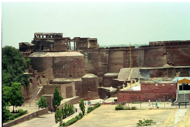
قلعه مبارک در شهر بتیندا ساخته شده توسط کنشکا

ساحه تحت اداره او از دو پایتخت: پروشاپورا [۵۸] (پشاور) و متورا [۵۹] در شمال هند اداره میشد. او همچنان مفتخر ( همراه با راجا داب [۶۰]) به ساختن قلعه بزرگ و مستحکم قدیم بتیندا [۶۱] (قیلا مبارک [۶۲])، در شهر مدرن بتیندا، پنجاب هند میباشد.