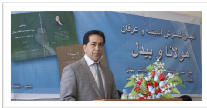
استاد سمیع رفیع

استاد نیستانی، به کارکرد های استاد سمیع رفیع که ابعاد مختلف فکری بیدل را با زبان پر رمز و رازش در این دو کتاب به بررسی گرفته است، تحسین سپرده، نیشته های گرانهای شان را به دنیای ادبیات و بیدل دوستان و بیدل پژوهان راستین، غنیمت روزگار دانست. هم چنان، استاد نیستانی، در مورد سبک هندی و آورده های استاد رفیع در این موضوع در کتاب «نقد شاعر آیینه ها» اشاره نموده، گفته های استاد رفیع را قابل توجه و با ارزش تلقی نمود.